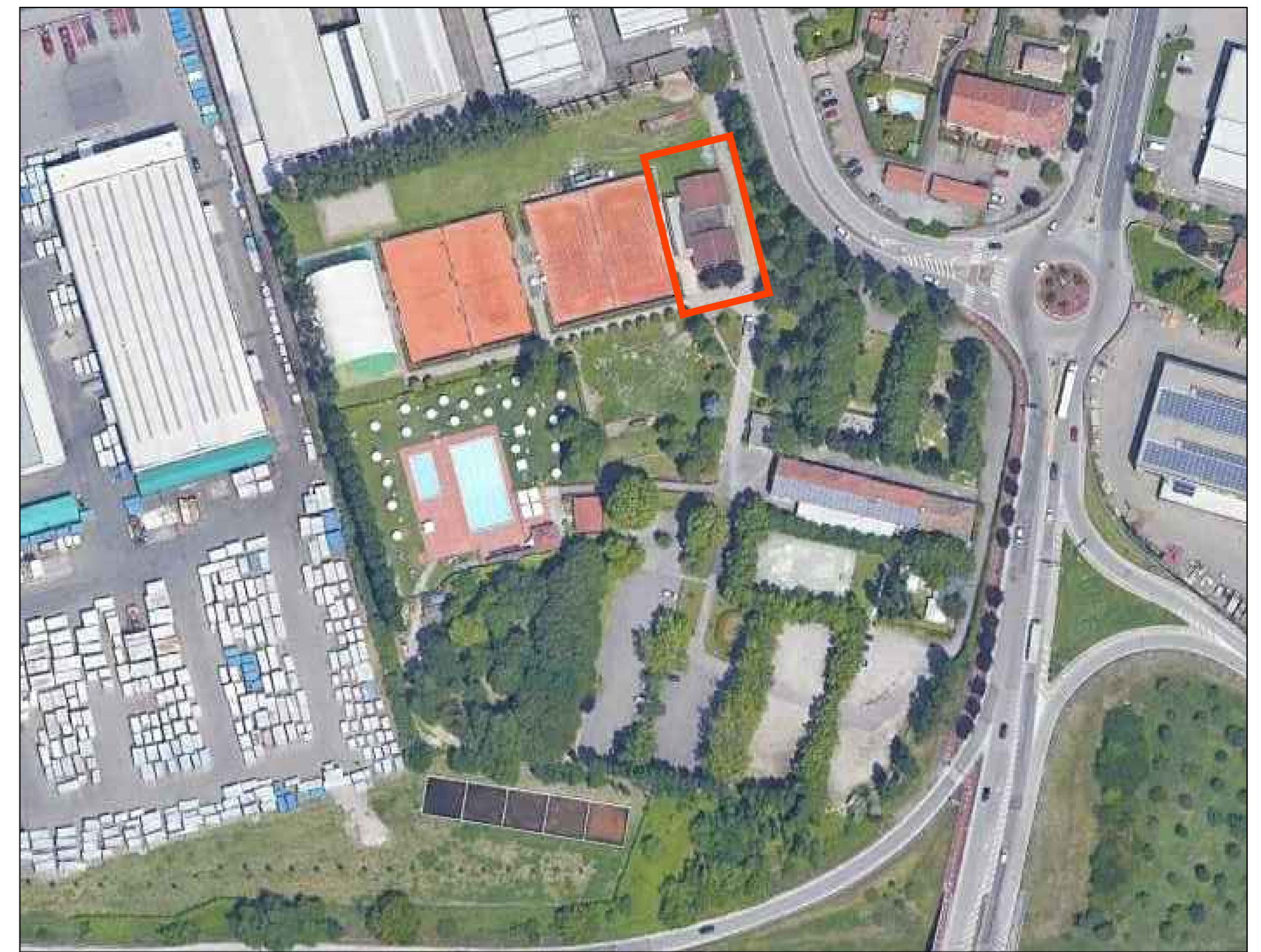
FOTO AEREA CON INDIVIDUAZIONE EDIFICIO OGGETTO DI INTERVENTO